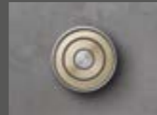
Tapa del eje SD4 RC3 probada