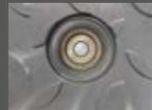
Tapa de alcantarilla SD 7 accesible