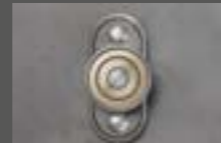
Tapa de registro SD2 Impermeable